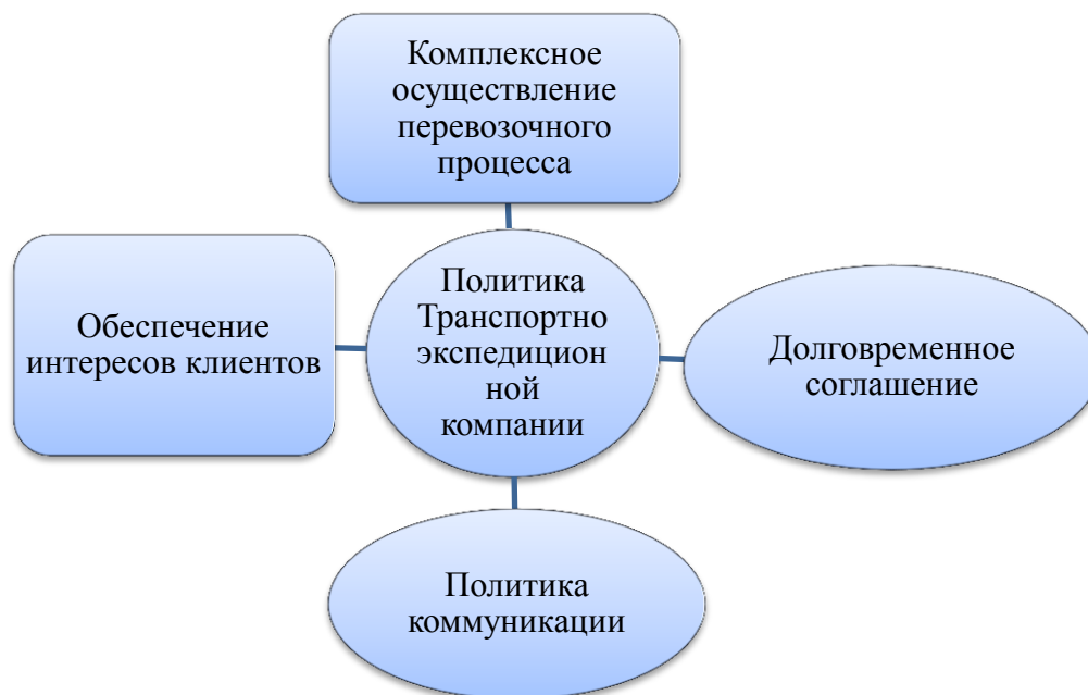
Рисунок 1 – Принципы логистики, формирующие политику транспортно - экспедиторской компании

Второй принцип - транспортно-экспедиторская компания связана с обеспечением интересов клиентов в области распределения товаров. Компания гарантирует, что переданный ей товар будет доставлен назначенному клиентом лицу точно в желаемом месте, в желаемое время, в желаемом количестве, в желаемом состоянии и конечно с суммарными минимальными затратами.