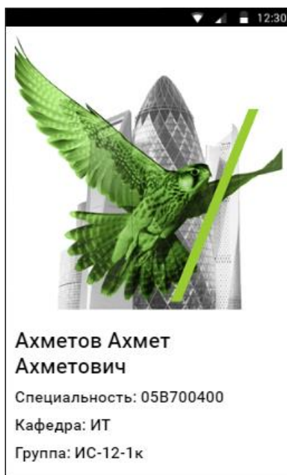
Сурет 2 – Студент беті

Пайдаланушы авторизация сәтті өткеннен кейін өзіне керек толық информация қарай алады.