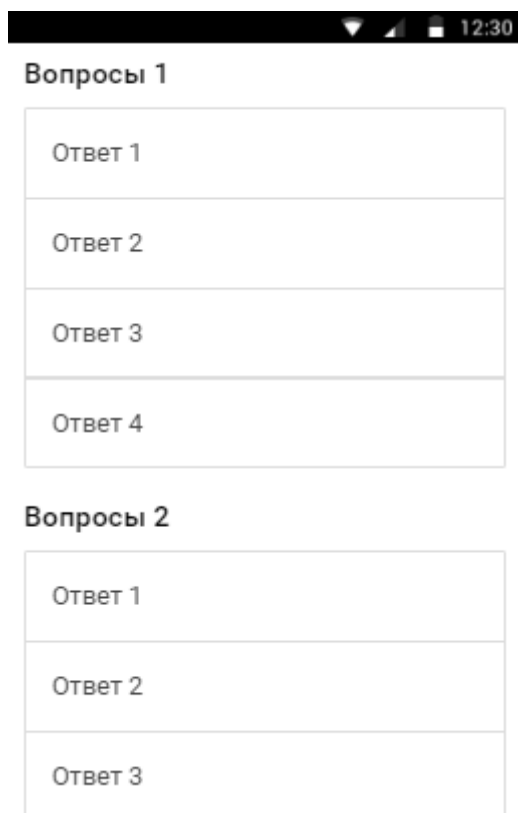
Сурет 3 – Сұрақ жауап беті

Оқытушы рейтингісінің мобильді қосымшасын пайдалану үшін қолданушы өзінің аккаунтімен кіру қажет. Кіргеннен кейін өзіне қажетті ақпараттарды ала алады.